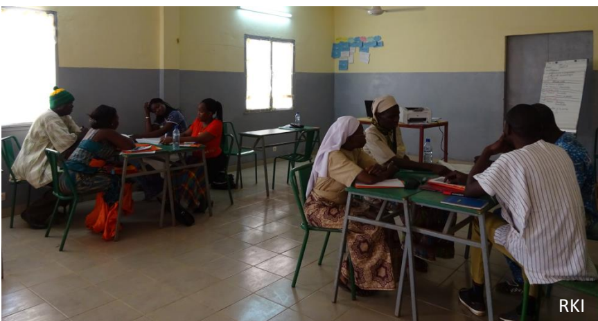
Les groupes discutent s'il s'agit d'un cas suspect